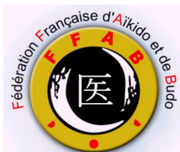
Commission Nationale Santé